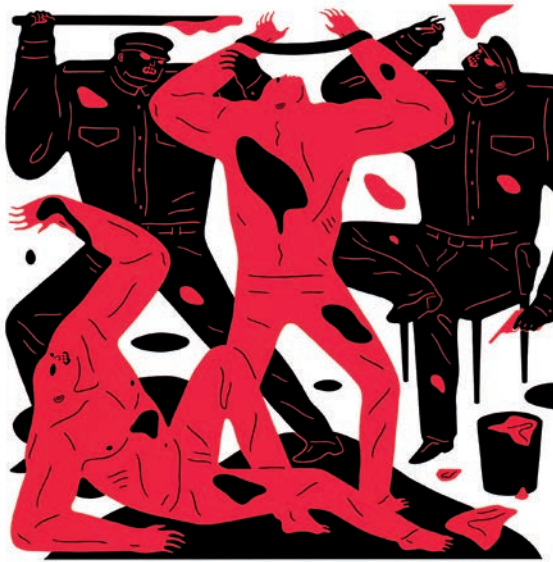
Cleon Peterson, de la serie Blood and Soil , 2018