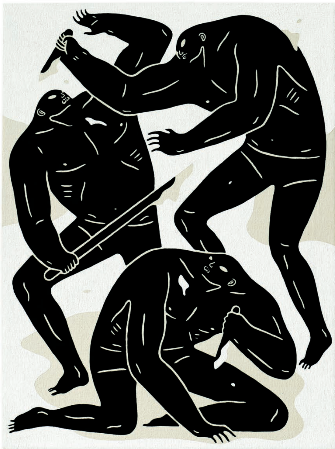
Cleon Peterson, Three Soldiers , 2016