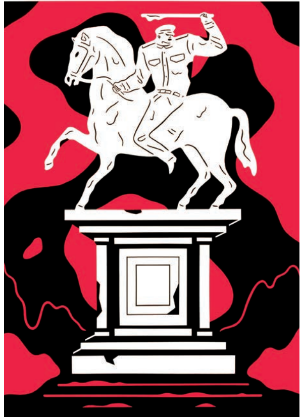
Cleon Peterson, de la serie Blood and Soil , 2018