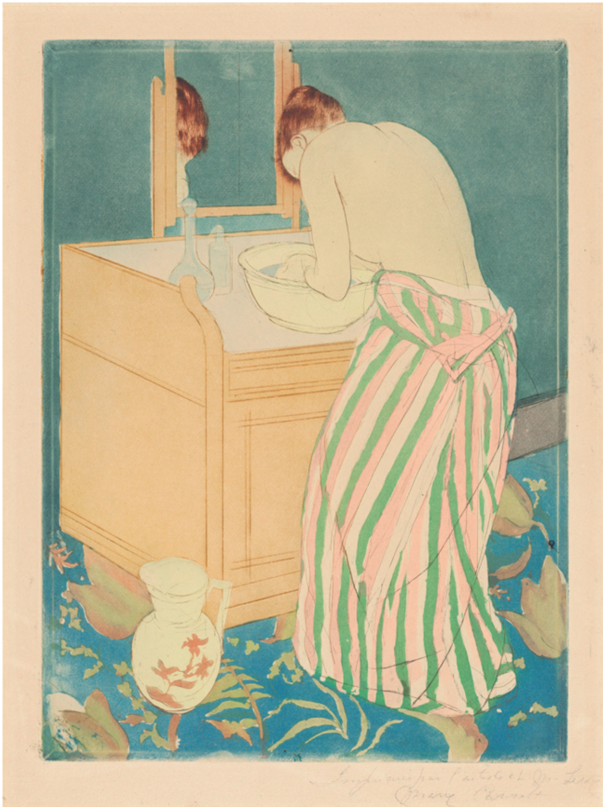
Mary Cassatt, Mujer bañándose , punta seca y agua tinta, 1890-1891