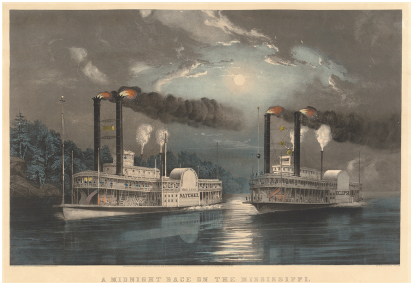
Frances Flora Palmer, Carrera de media noche en el Mississippi , cromolitografía con coloreado a mano, 1860