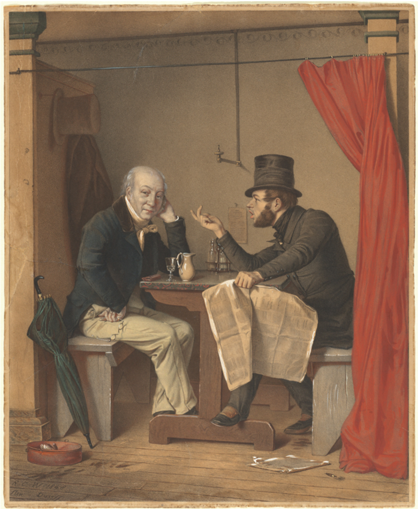
Michele Fanoli, Política en un restaurante de ostras , litografía coloreada a mano, 1851