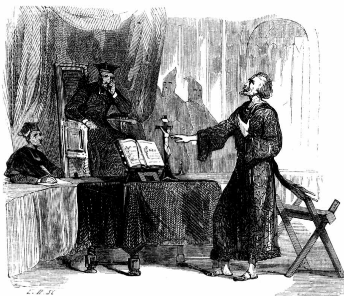
Tribunal de la Inquisición