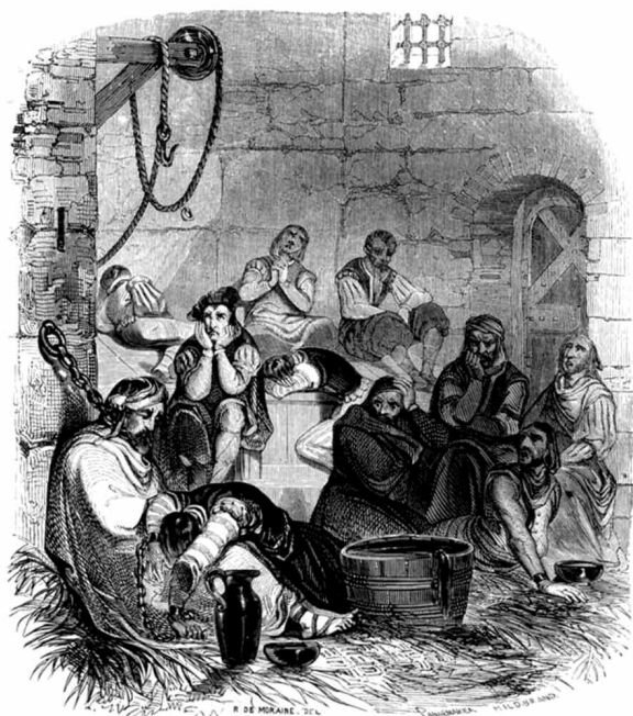
Interior de una prisión de la Inquisición