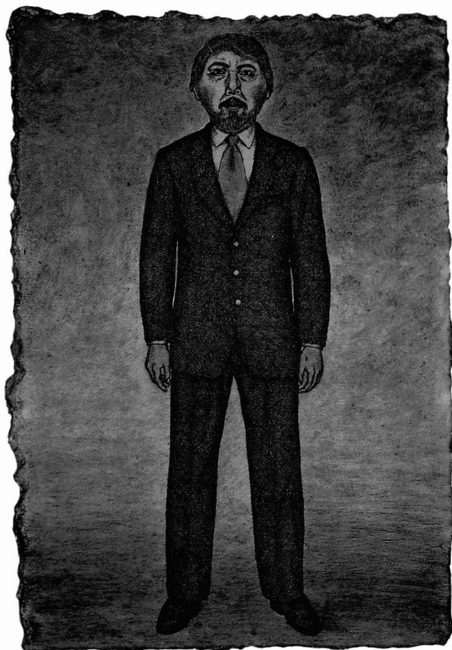
Técnica mixta, 28.5 x 20 cm c/u

Acumulada ahora larga soledad de veinte años y más, vida sin vida, muerte sin muerte, nada pisando sobre enigmas; con traje negro de gala por calles de ciudad con ojos que se te quedan mirando gentes y cosas externas que no miras porque te miras: larga soledad ahora.