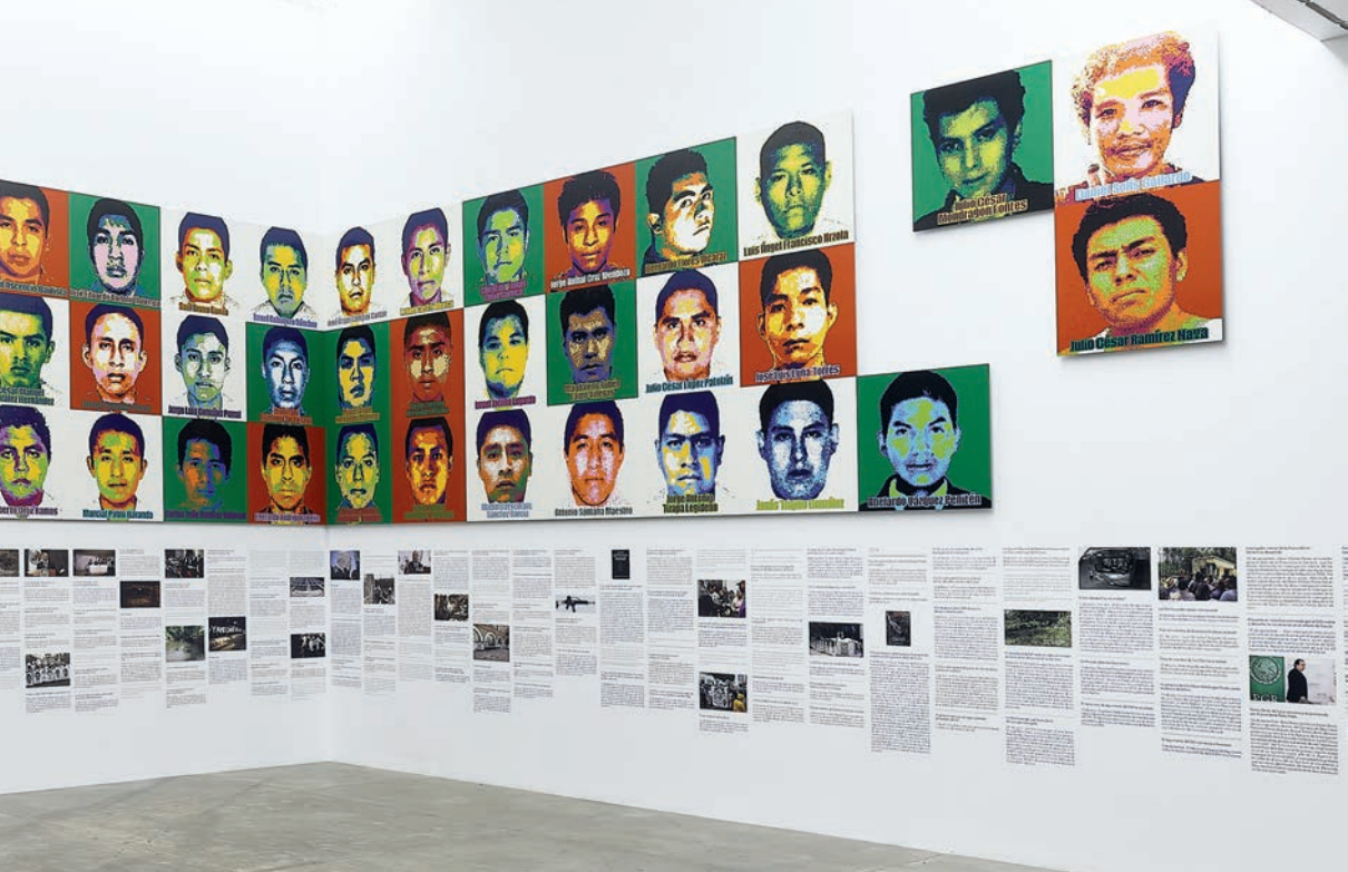
Ai Weiwei, Retratos de LEGO relacionados con el caso Ayotzinapa , 2019. Cortesía del MUAC/UNAM

traz, que reproducía los rostros y nombres de presos políticos, permitió a Ai corregir el problema de resolución que tenían de origen muchas imágenes, a la par de que el contraste entre las caras multicolor y la ruina del espacio provocaba un lúdico acercamiento a un tema y a un recinto que eran por demás severos.