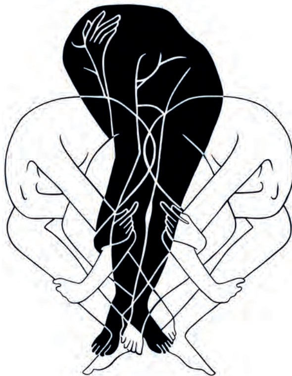
María Conejo, Red invisible , 2017

La primera fragmentación del cuerpo o asignación del sexo se lleva a cabo mediante un proceso que llamaré, siguiendo a Judith Butler, invocación performativa. Ninguno de nosotros ha escapado de esta interpelación. Antes del nacimiento, gracias a la ecografía —una tecnología célebre por ser descriptiva, pero que no es sino prescriptiva— o en el momento mismo del nacimiento, se nos ha asignado un sexo femenino o masculino. El ideal científico consiste en evitar cualquier ambigüedad haciendo coincidir, si es posible, nacimiento (quizás en el futuro, incluso fecundación) y asignación de sexo. Todos hemos pasado por esta primera mesa de operaciones performativa: “¡es