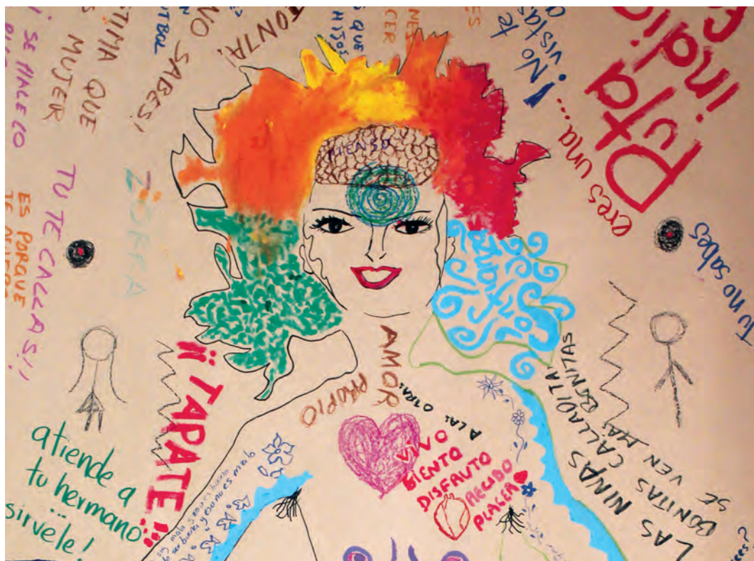
Cartografías a escala corporal.

• Un acercamiento por parte de la comunidad a la noción de espacio, lo cual es una invitación directa a ubicarse en el mapa y a pensar el territorio propio desde la escala corporal hasta la global.