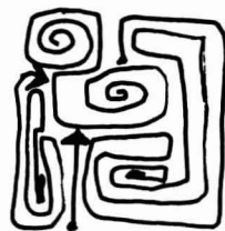
MIGUEL LEÓN-PORTILLA, Tres formas del pensamiento náhuatl . UNAM. México, 1959, 32 pp.

Este breve volumen (más valioso por lo que sugiere que por lo que expone) ofrece una muestra de la riqueza del pensamiento náhuatl (entre los siglos xv y xvi), que indudablemente estaba influido, en su mayor parte, por los místicos pensadores toltecas. Los nahuas como pueblo guerrero necesitaban una justificación y un estímulo para su política expansiva, y supieron encontrarlo creando un dios sanguinario: Huitzilopochtli; pero al lado de esta "visión místico-guerrera del universo", existió una "concepción del mundo a base de números", que, aunque teñida de carácter místico, computaba el tiempo y medía el espacio con asombrosa precisión científica. Otro grupo de sabios, renovando la teología y la filosofía de los toltecas, sostenía que la raíz de la verdad estaba en la poesía ("visión estética del universo"), y que el artista era "un corazón endiosado", es decir un visionario que poseía la verdad.